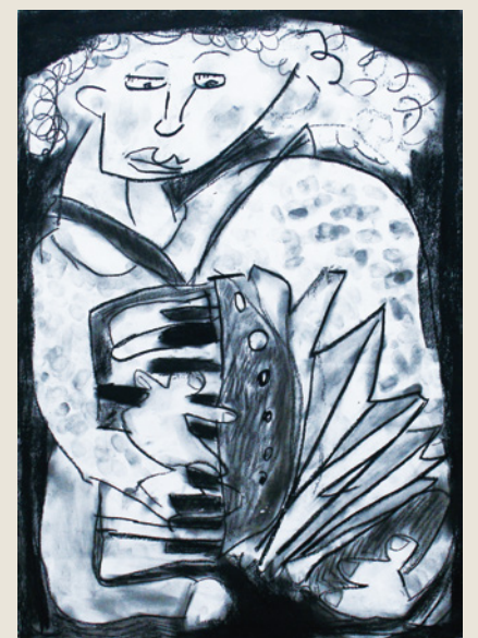
アコーディオンをひく女 ひと