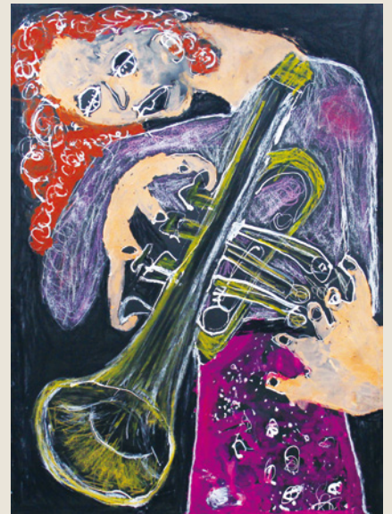
トランペット奏者

〈お問い合わせ先〉 TEL089-909-8508 愛媛県松山市祝谷二丁目10-12 株式会社シンプル内(mayutamago展覧会開催実行委員会まで)